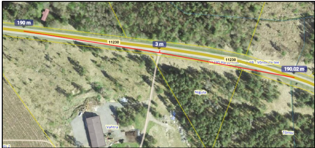
Joonis 2. Väljavõte Maa- ja Ruumiameti teeregistrist