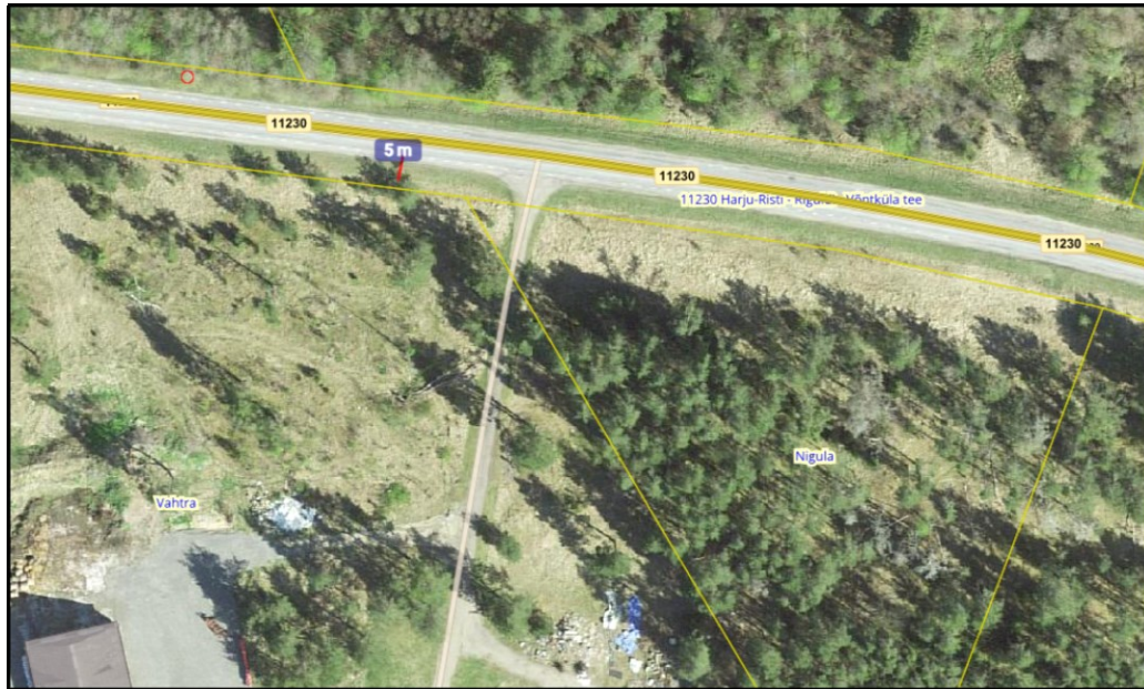
Joonis 1. Väljavõte Maa- ja Ruumiameti teeregistrist

Vaba ruum on ruum ohutuse tagamiseks liiklevate sõidukite ja tee ristprofiilis paiknevate ehitiste vahel, mh talihooldetööde ohutuks teostamiseks. Normide kohane vaba ruumi laius on 5,0 m. Piirdeaia rajamisel väljapoole riigitee alust maad on vaba ruumi nõue täidetud (vt joonis 1 ).